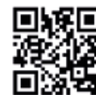
Tantal Brasil Tungsten Solutions